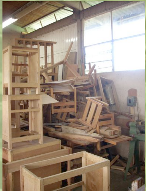
Pour nos structures: on utilisera les retailles!

Nous avons d'ailleurs trouvé un fournisseur de vers et de compost dans les environs de Tlaxiaco. Puisqu'on est dans le sujet des fournisseurs : nous avons également passé notre commande de plantules (bette à carde, betterave, tomates) et de semences (coriandre, fèves, radis) afin d'avoir le nécessaire pour commencer en janvier.